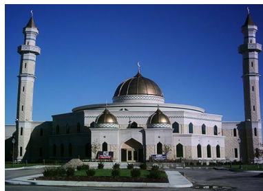
مرکز اسلامی امریکا در دیربرن ایالت میشیگن

در سال ۱۹۹۱ توسط سکید مور، اوینگز و میریل تکمیل گردید. شکل سنتی دوره عثمانی آن و همچنین تصاویر هندسی اسلامی و خطاطی آن به طور موثر زبان معماری معاصر را بیان نموده است. بار یکی مناره، ضرافت هنری و معنوی با ارتفاع مناره تقابل زیبایی را در برابر بزرگی این مسجد به خوبی نشان داده است. این طراحی نتیجه یک مناظره جالب توجه در مورد این مسجد قرن ۲۱ است که تصویری از حرمت را برقرار می سازد که بیشتر مردم را مشمول می سازد تا اینکه محروم بسازد. از آنجا بیکه تکمیل شدن این مرکز در سال ۱۹۹۱ انجام شد این مسجد یک نشان اختصاصی در منهایتن گردیده است.