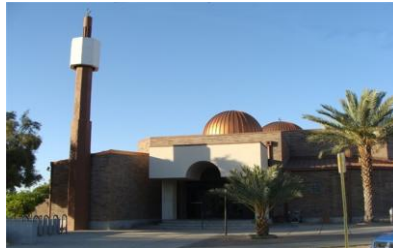
مرکز اسلامی توسان در ایالت آریزونا در سال ۱۹۹۰ ساخته شد. این مرکز در سال ۱۹۹۶ تاسیس گردید.