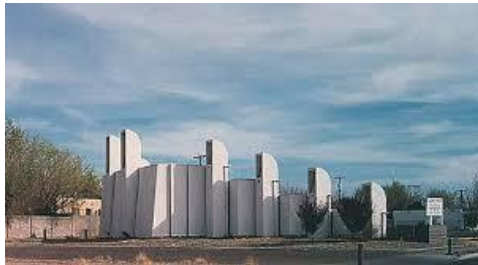
مرکز اسلامی البکرکی در البکرکی ایالت نیومکسیکو

بین سالهای ۱۹۸۵ تا ۱۹۸۶ توسط بارت پرینس ساخته شد. طرح ابتکاری این مرکز اسلامی ممکنات علم هندسی، فضا، تعمیر سازی و مواد تعمیرات را مورد تجدید نظر قرار داده است. این مسجد در سال ۲۰۰۵ تخریب شد تا فضایی برای ساخت یک مرکز اسلامی جدید در نیومکسیکو که فعلا در حال اعمار است فراهم شود. این تخریب سبک ابتکاری در حمایت از سبک سنتی تر منعکس کننده سلیقه تغییر در جامعه این محل است.