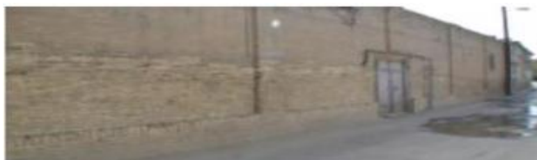
تصویر شماره: ۳: جاری شدن فاضلاب منازل داخل بافت معابر فرسوده (میدان شهدا)

امروزه اکثر مردم از ارزش و اهمیت بهداشت محیط زیست و نقش آن در سلامتی فردی و اجتماعی آگاهی دارند. اما بخش قابل توجهی از ساکنین این محلات، کوچه ها و خیابان های بافت های فرسوده شهری به دلیل فقر و بیسوادی حاکم در این مناطق، رعایت نکات بهداشتی را بعنوان یک وظیفه شهروندی به نحو احسن رعایت نمی کنند.