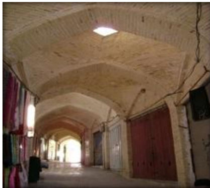
شکل (۷) - پوشش سقف بازار

نوع طاق و قوس های آنها عبارت اند از طاق های پنج وهفت کند در دهانه های اصلی محور عبوری بازار و قوس های چهاربخشی یا پنج وهفت خفته در دهنه ورودی مغازه ها که بیشتر جنبه ورودی مغازه ها را شامل می گردد. پوشش سقف مغازه ها و دکان های بازار معمولاً از جنس تیرچوبی می باشد براساس حدسیات مشاور و بررسی های میدان می توان گفت که سقف بخش اعظمی از مغازه ها بازار در دوران اخیر مورد بازسازی به وسیله تیرهای چوبی قرار گرفته و به سقف تخت تبدیل گشته است. علیرغم نکات گفته شده همچنان می توان در سراسر طول بازار مغازه هایی را یافت که دارای سقف گنبدی و طاق و تویزه می باشند و به اصطلاح بخش سقف آنها به شکل اصیل و دست نخورده باقی مانده است.