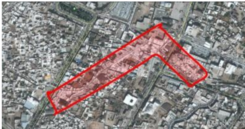
شکل (۳) - نقشه موقعیت بازار در شهر کرمانشاه