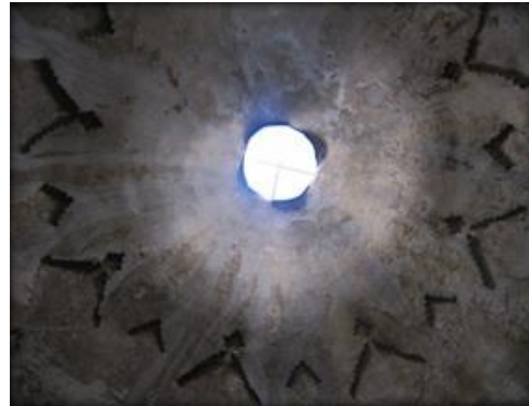
شکل (۶) - پوشش سقف بازار