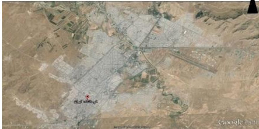
شکل (۲) - نقشه شهر کرمانشاه

موقعیت مکانی بازار کرمانشاه و عناصر وابسته به آن از لحاظ موقعیت مکانی بازار در جهت شرقی - غربی در میان شهر گسترش یافته است. این بازار محور اصلی راه تهران به بغداد (راه کربلا) و به عنوان یک مرکز مهم تجاری تا زمان گسترش شهر کرمانشاه و ساخت خیابانها مطرح بوده است. مرکز آن در میدان توپخانه (سبزه میدان کنونی) در قسمت مرکز شهر بوده است بازار شرقی - غربی از هنگامی که برخی راههای آن توسط خیابان هایی که ارتباط با دیگر مبادین ورودی و خروجی شهر بود قطع گردید و به بازارهای گسسته تبدیل گردید.