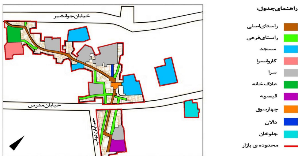
شکل (۴) - نقشه فضاهای مختلف بازار کرمانشاه